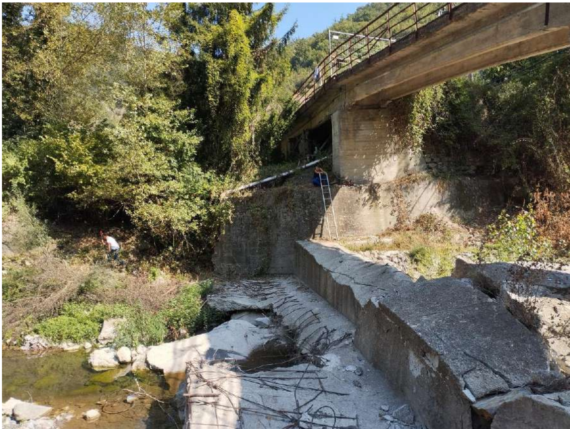
P.V. 6 - agosto 2024