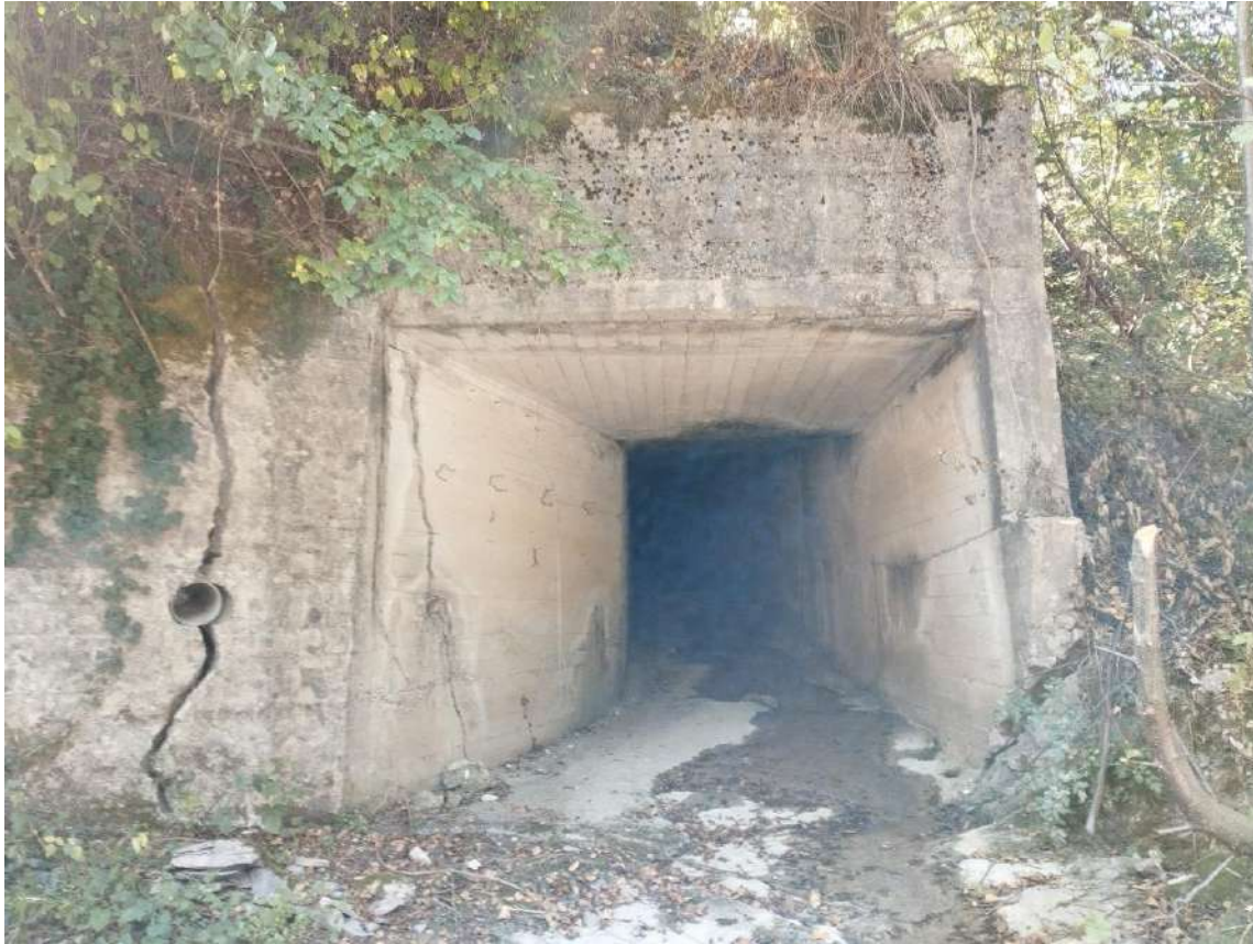
P.V. 13 - agosto 2024