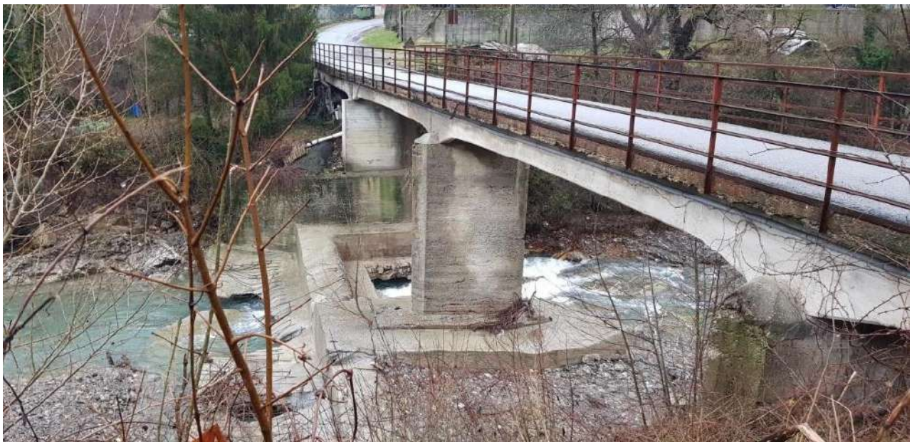
CONDIZIONI PONTE FEBBRAIO 2021