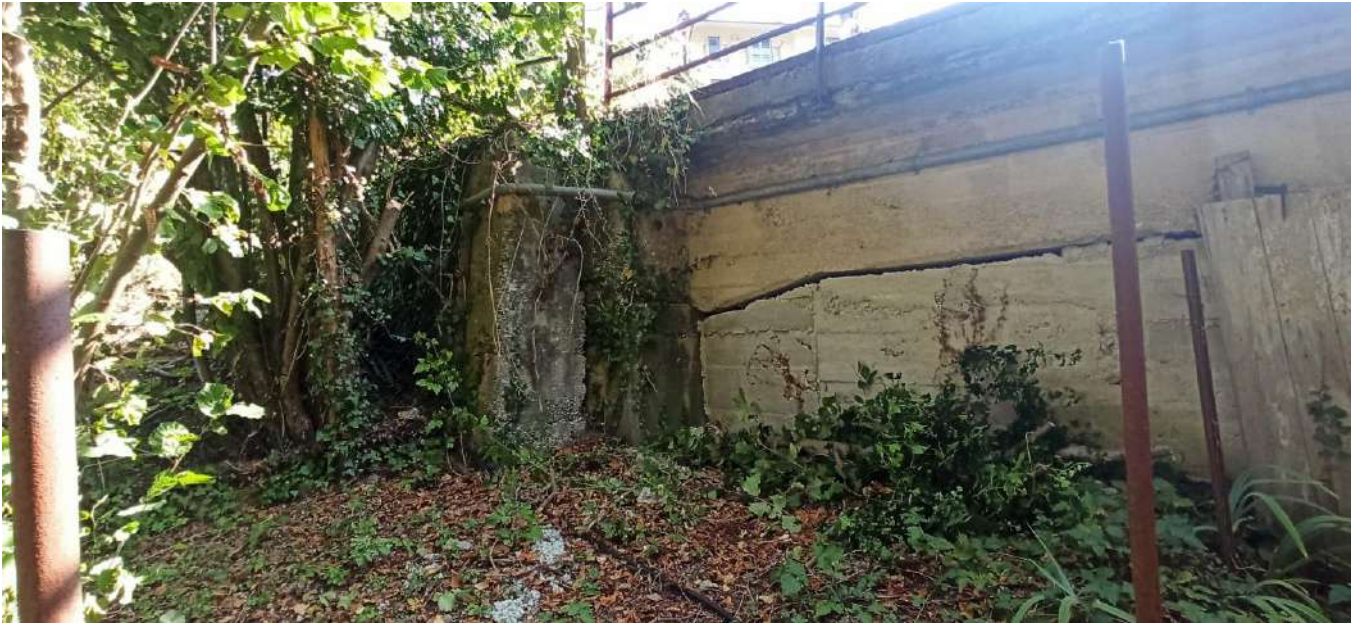
P.V. 9 - agosto 2024