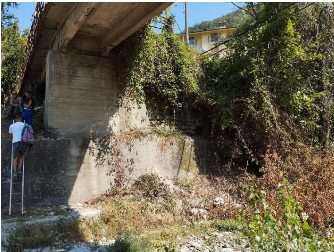
P.V. 8 - agosto 2024