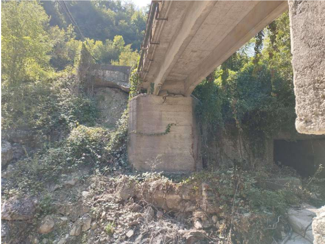
P.V. 5 - agosto 2024