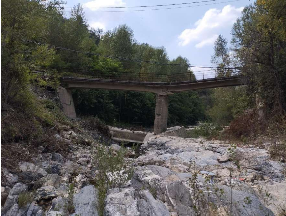
P.V. 1 - agosto 2024