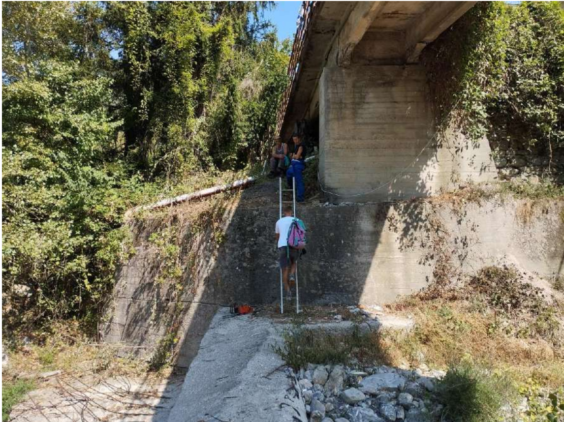
P.V. 7 - agosto 2024