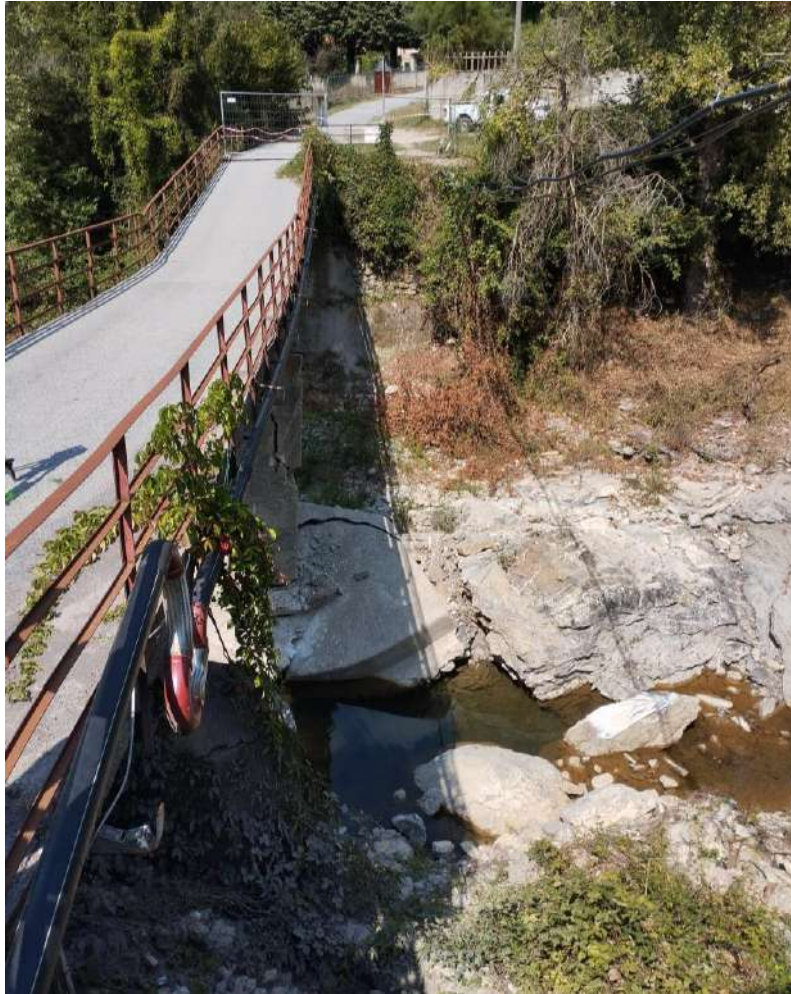
P.V. 3 - agosto 2024