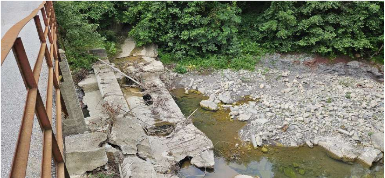
P.V. 11 - agosto 2024