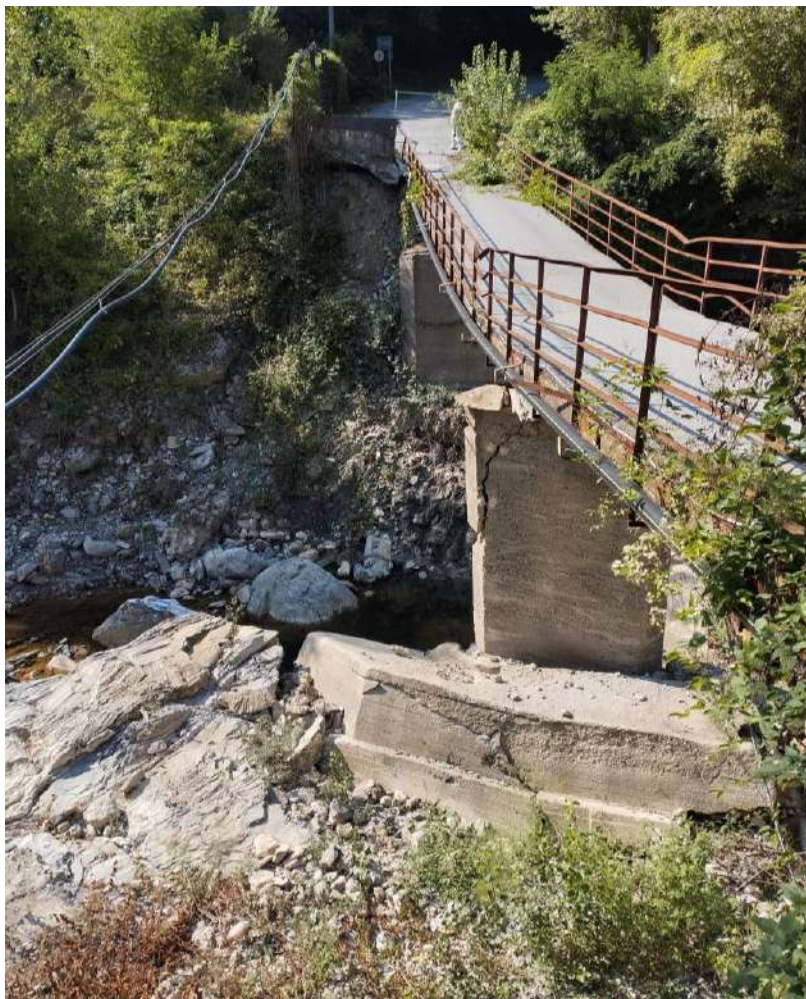
P.V. 4 - agosto 2024