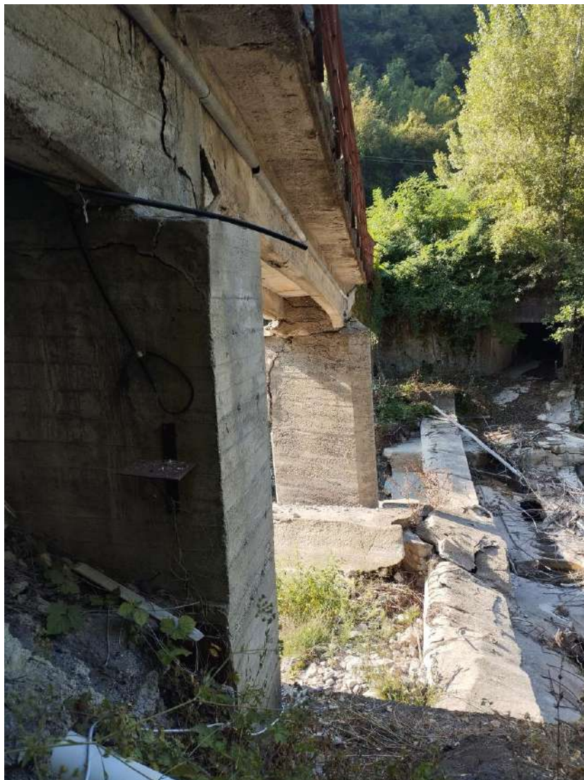
P.V. 10 - agosto 2024