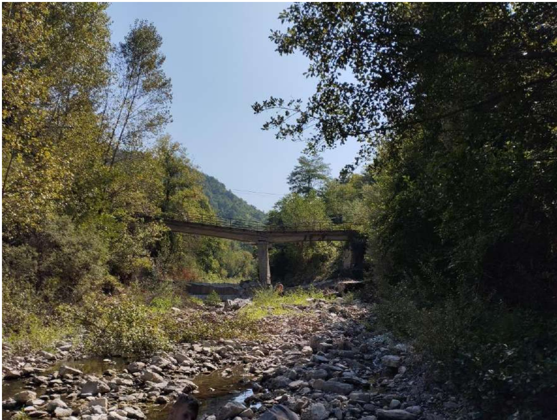
P.V. 14 - agosto 2024