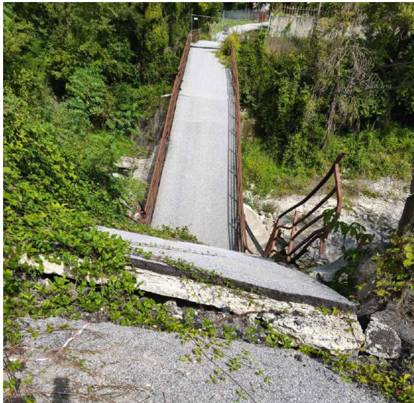
P.V. 3 - settembre 2025