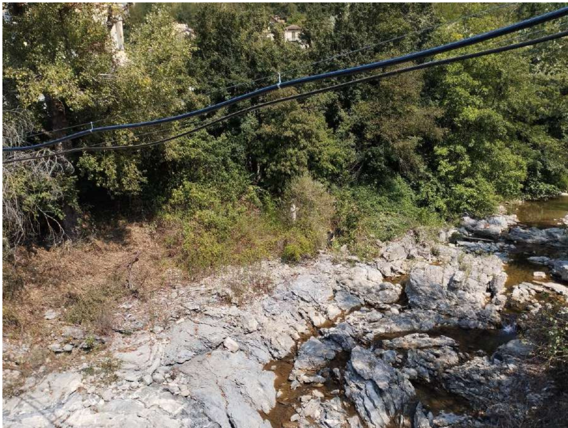
P.V. 2 - agosto 2024