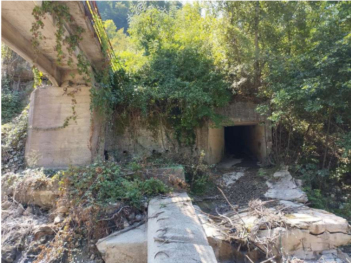
P.V. 12 - agosto 2024